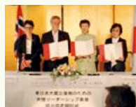
「東日本大震災復興のための女性 リーダーシップ基金」協力協定調印式