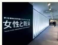
第3回国連防災世界会議パブリック フォーラム「女性と防災」テーマ館