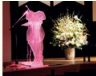
スピーチテーブル「グロ」