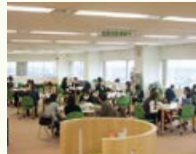
エル・ソーラ仙台 市民交流スペース