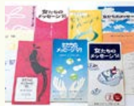
「女たちのメッセージ」