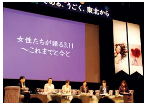
日本女性会議 2012 仙台 特別プログラム

水野 全国的、また国際的な広がりがある場にはありました。やはり生身で会って話をするのは違いますね。とてもエポックメイキングな会