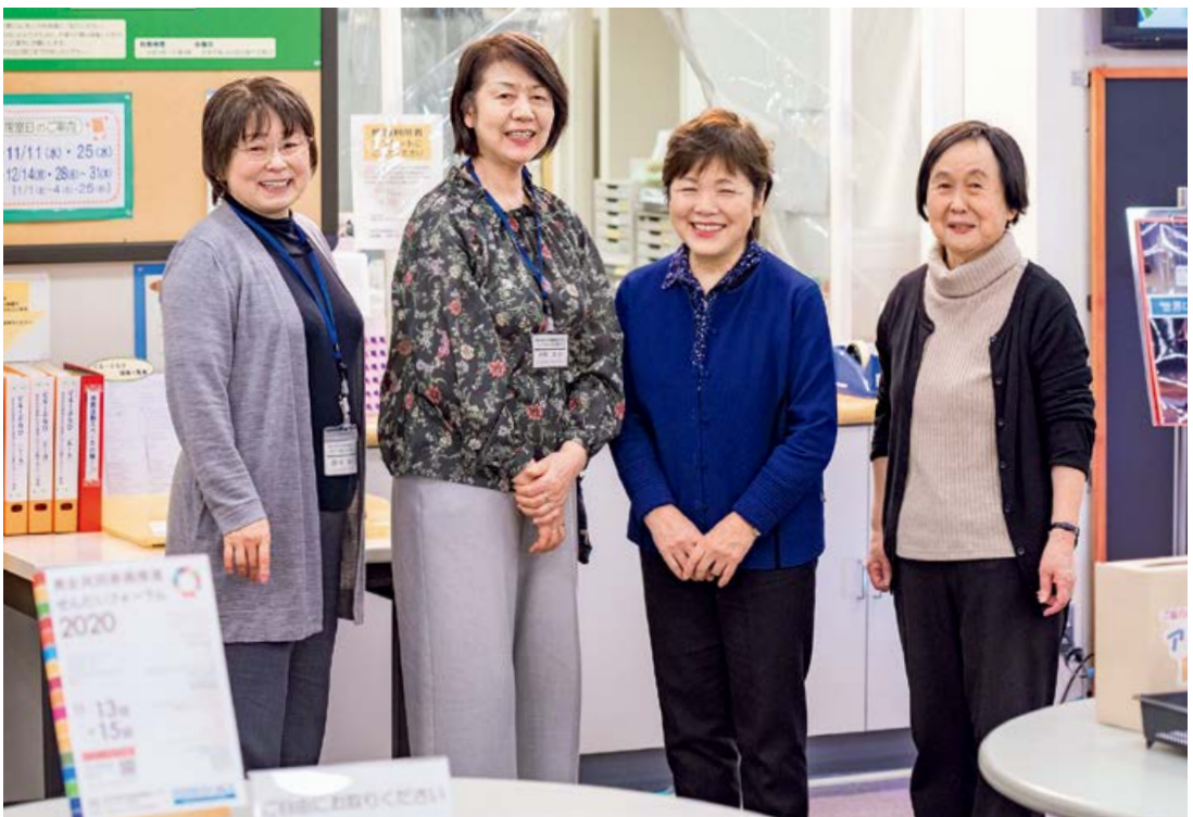
利用者ととも市民活動スペースを育ててきたイコールネット仙台のみなさん

——私たち財団の職員はイコールネット仙台から学んだことがたくさんあります。これからも一緒に「男女平等のまち・仙台」に向けた取り組みを進めていきたいと思っています。本日はありがとうございました。