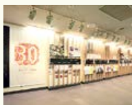
エル・パーク仙台30周年 エントランス展示