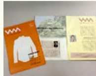
財団広報誌「WM・ダブリュ・エム」 創刊号(財団設立記念特集号)