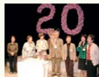
エル・パーク仙台20周年 記念イベント