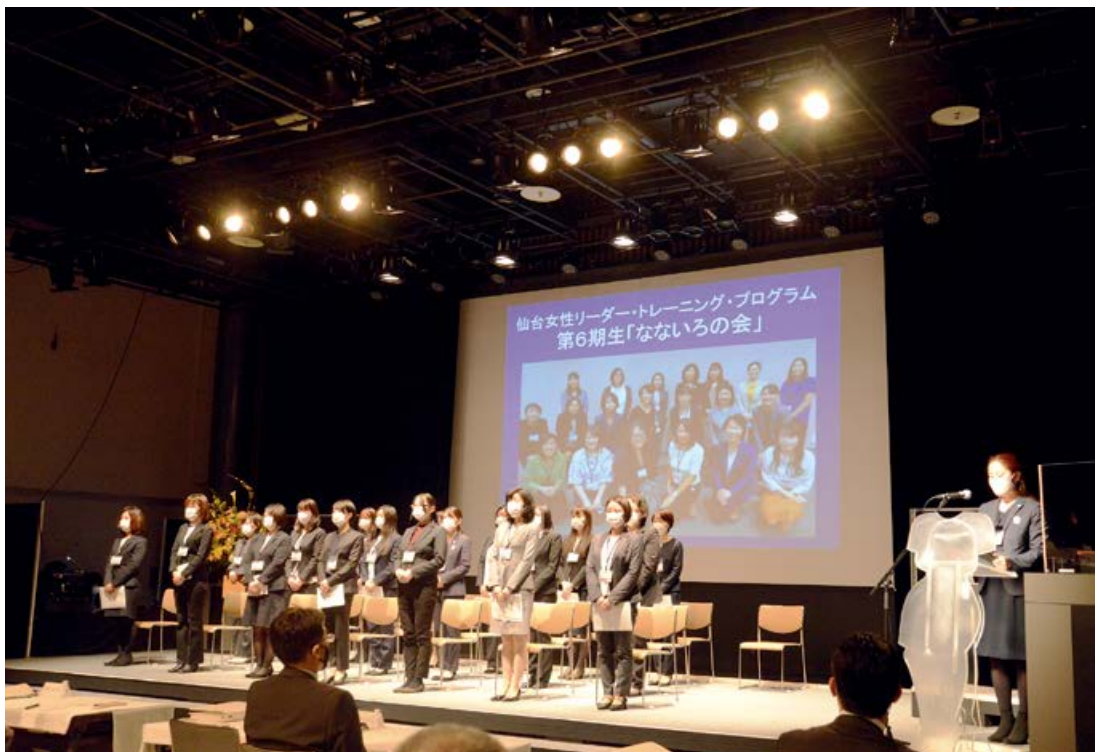
仙台女性リーダー・トレーニング・プログラム 2020 修了式

木須 「政治分野における男女共同参画の推進に関する法律（*3）」が2018年に施行されましたが、いきなり政治家になるというのはハードルが高いと思います。自分が住むエリアのまちづくりや、職場といった