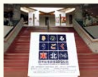
日本女性会議 2012 仙台