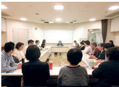
2019年度ジェンダー論講座

「ジェンダー論講座」を、 エル・ソーラ仙台が開館し た2003年から続けて います。その中で、男女 共同参画は女性の問題で はなく、全人類の問題だ と伝えていきます。産業面 で見ると、かつての重厚 長大産業(*2)では男性 の労働力が非常に重要 でしたが、今は情報産業 がGDPでも大きなウェイトを占め、 サービス産業も含めて労働人口も多 い。これからの社会では、性別を問