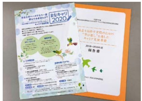
自立を目指す女性のための「学び直し」を通じたキャリア支援事業

くづく私は動物だなと思いました。たとえアクリル板やマスク越しであろうと、生身の彼らと会えると全然違います。人と会うことにはそういう力がある。例えば、家庭環境がすごく劣悪でも、近所の交通安全全のおじさんが「元気かい？」と言ってくれることが子どもにとってとても