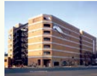
141ビル外観(エル・パーク 仙台開館当時)