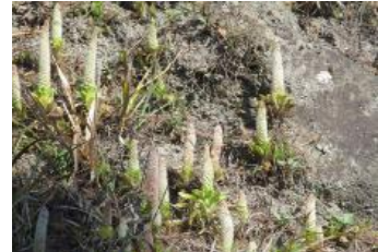
アオノイワレンゲ