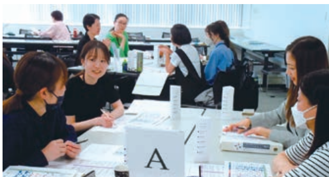
2025 マネージャーコース プログラムの様子

自分の強みを理論的に確認できました。どう活かすか、周囲の人とどう接すればより成果につながるか意識しています。リーダーとしての立ち位置がはっきりしたので、部下の強みも活かしながら成長を促す関わりで積極的にコミュニケーションを取り、次世代のキーパーソンを育成します。（情報通信業／50代）