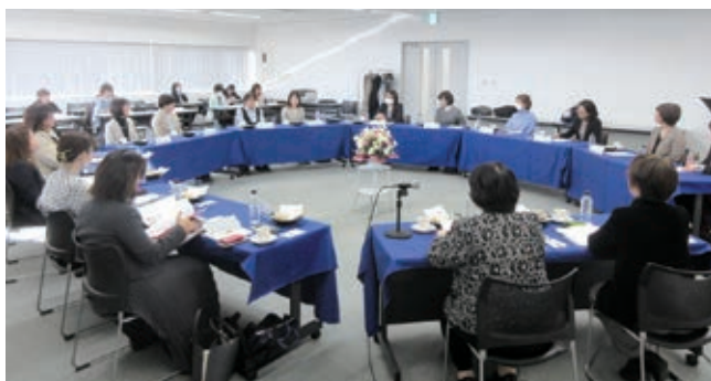
2024 エグゼクティブコース懇談会